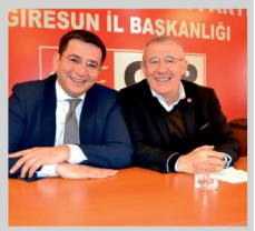
Señecek. Sahi CHP'de üyeler ne işe yarıyor. Seçmedikten, seçilmeyenlerden sonra...

Demokrasiyi kendi örgüt yapıları içinde hiç uygulamayan bir CHP'nin, Türkiye'ye demokrasi yayılmıyorsa kadar inandırıcı olacaktır? Diğer kentlerde de durum aynı olacak ve 28-29 Mart 2020 tarihinde gerçekleştirilecek 37. olağan genel kurulunda da genel başkan, parti yönetimi aynı anti demokratiklikle