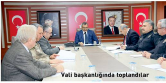
Vali başkanlığında toplandı

Ötobüs kaza raporları önlenmesine yönelik önlemler ve çalışmalar değerlendirildiği toplantıda konuşan Vali, "Buna ilişkin en üst düzeyde hassasiyet göstermeye çalışıyoruz. Ben bütün trafik kontrol ekiplerimize bu konuda talimat verdim. Kurallara uymayan kim varsa, resmi kurum özel