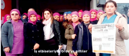
İşletmelerin Ordu'ya gittiler