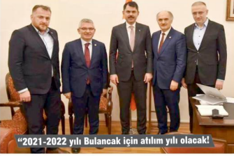
"2021-2022 yılı Bulanacak için atılım yılı olacak!"