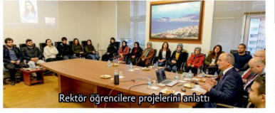
Rektör öğrencilere projelerini anlattı