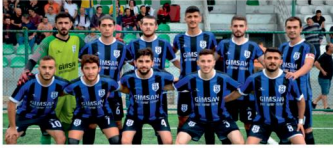
Sökenspor futbolcuları, antrenörleri ve yöneticileriyle bir araya gelerek fotoğraf çektirdi.

Yeniörsör engelini 2-1'lik skorla aşan Mavi-Siyahlı ekip, puanını 13'e çıkardı. Yağlıdere spor ise Keşap Belediyespor beraberliğiyle puanını 11 yaptı. Sökenspor bu hafta sonu sahasında İhsaniye ile oynayacağı maçtan puan ya da puanlar çıkarması halinde Yağlıdere spor-Yeniörsör maçının skoruna bakmadan ligde kalışını ilan etmiş olacaktı.