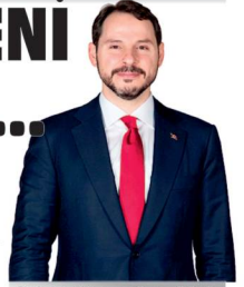
Bakan Albayrak açıkladı.

Böylece Hazine ve Maliye, Defterdarlık, Gelir Uzman Yardımcıları ile Vergi Müfettiş Yardımcılığı ve Avukat kadrolarını içine alan 2 bin kadronun müjdesini veriyoruz" ifadelerini kullandı. Personel alımında devletlerin yer aldığı paylaşım göre, sözlü ve yazılı sınav yöntemleri kullanılacak.